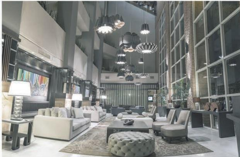
Hotel Camino Real - Santa Cruz de la Sierra

Protagonistas del desarrollo inmobiliario local reflejado en los edificios más emblemáticos como el Centro Empresarial Torre Dúo, Condominio Aguaí y el Condominio Villa Magna.