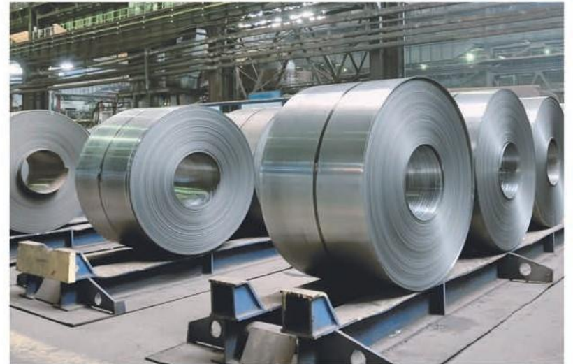
Empresa Las Lomas

Avalado por más de 60 años dedicados a la importación, reciclado de fierro y acero y un indiscutible liderazgo reflejado en la participación activa y fundamental en el desarrollo de la construcción y la industria boliviana.